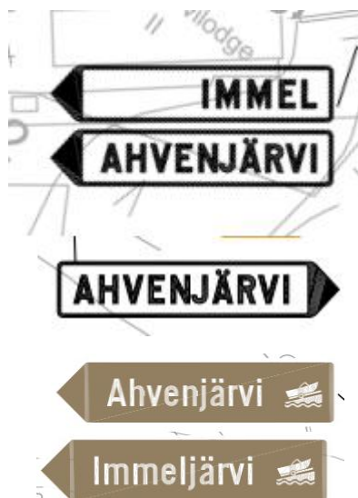
Kuva 4. Kuvaoitteet paikalliskohde- sekä palvelukohteen opasteviitoista

Katu- ja tieliittymiin asennetaan väistämisvelvollisuutta osoittavat kärkikolmiot lukuun ottamatta Ahvenmutkan Ahvenperä, Ahvenpisto, Ahvenpätkä katuja sekä Tuomaanniementien Tuomaankuja ja Tuomaanpisto-katuja, jotka ovat tasarvoisia (väistämisvelvollisuus oikealta tulevia kohtaan).