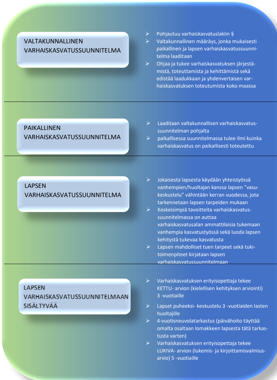
Kuvio 1. Varhaiskasvatuksen tasot Kittilässä