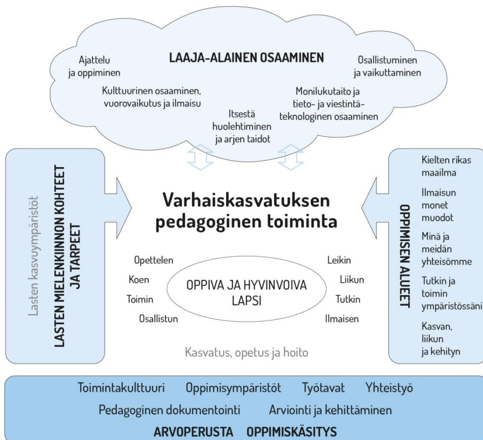
Kuvio 2. Varhaiskasvatuksen pedagogisen toiminnan viitekehys

Varhaiskasvatuksen suunnittelu perustuu henkilöstön tietoon varhaispedagogiikasta sekä lapsen ja lapsiryhmän havainnointiin. Varhaiskasvatuksen pedagogista toimintaa ja sen toteuttamista kuvaa kokonaisvaltaisuus. Tavoitteena on edistää lasten oppimista ja hyvinvointia sekä laaja-alaista osaamista (kuvio 2). Pedagoginen toiminta toteutuu lasten ja henkilöstön välisessä vuorovaikutuksessa ja yhteisessä toiminnassa. Lasten omaehtoinen, henkilöstön ja lasten yhdessä ideoima sekä henkilöstön johdolla suunniteltu toiminta täydentävät toisiaan. Varhaiskasvatuksen pedagoginen toiminta läpäisee kasvatuksen, opetuksen ja hoidon kokonaisuuden.